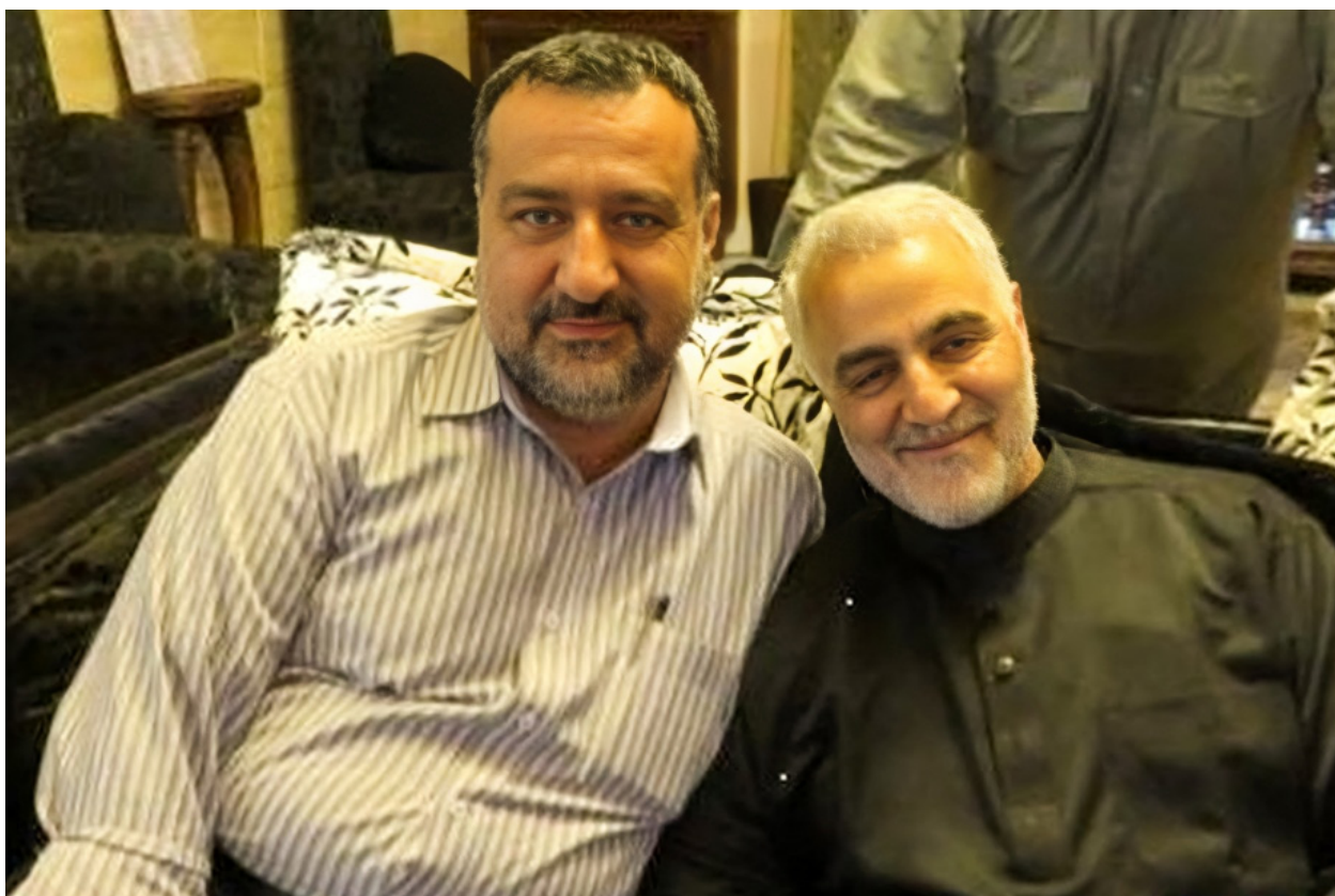
عکس آرشیو: رضی موسوی را در کنار قاسم سلیمانی نشان می دهد

به لبنان را بر عهده داشت. بنا به برخی منابع او ۳۰ سال در سوریه فعالیت داشت؛ از این رو می توان او را فرمانده «سپاه قدس» در سوریه دانست؛ به ویژه اینکه قآانی در سوریه چندان محبوبیت و خبرگی ندارد. لذا، جای تعجب نیست که اسرائیل وی را به عنوان یک شخصیت کلیدی مورد هدف قرار دهد و با از میان برداشتن او، ارتباط لوجستیک میان سپاه پاسداران ایران و گروههای شبه نظامی مورد حمایت ایران در سوریه و حزب الله لبنان را قطع کند؛ گفتنی است که از اکتبر ۲۰۲۳ میلادی که جنگ اسرائیل و حماس شعله ور شده است، این گروهها نیز در گرماگرم جنگ کنونی، کمر به تهدید منافع اسرائیل بسته اند.