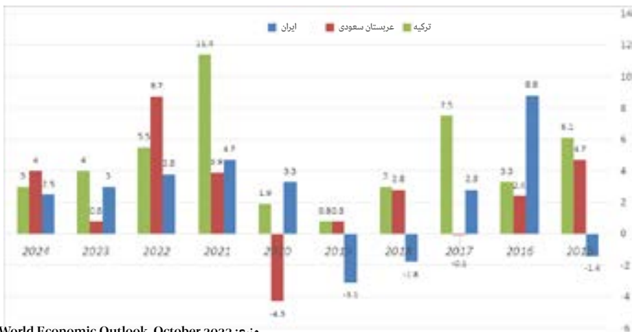
شکل (1) رشد تولید ناخالص داخلی واقعی ایران را در طول سالهای 2015-2024 به درصد نشان می دهد

علی رغم اینکه در پی افشای این پرونده بزرگ فساد، دولت ابراهیم رئیسی علاوه بر خشم مردمی، در معرض اتهامات و انتقادات گسترده ای قرار گرفته است و کارشناسان اقتصادی نیز تأکید کرده اند که 80 درصد این فساد در دولت ابراهیم رئیسی رخ داده است، اما سیاست رسانه ای نظام تلاش دارد با تبلیغ این مطلب که دولت رئیسی این فساد را کشف کرده و با دست اندرکاران آن با قاطعیت برخورد کرده است، دولت رئیسی را از این فساد تبرئه کرده و تمام مسئولیت ها را متوجه دولت حسن روحانی کند. به نظر می رسد که نظام ایران بیم آن دارد که مبادا در این شرایط سخت اقتصادی، این مسأله همچون جرقه ای خشم مردمی را شعله ورساخته و بار دیگر اعتراضات ضد حکومتی را به دنبال داشته باشد؛ به ویژه اینکه بر ملا شدن فساد به این گستردگی برای ابراهیم رئیسی بسیار گران تمام می شود. او که از سال 2019 میلادی ریاست قوه قضائیه را عهده دار شد و در 2021 میلادی بر کرسی ریاست جمهوری تکیه زد، همواره از مبارزه با فساد دم زده است.