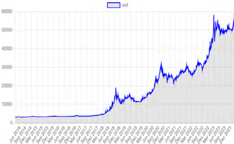
شکل 1: بهای دلار آمریکا در مقابل تومان ایرانی (ژانویه 2024م)

گزارش اقتصادی ماه ژانویه 2024 میلادی به افزایش چشمگیر قیمت دلار در مقابل پول ملی ایران می‌پردازد. و به این نکته توجه می‌کند که در میان ارزهای خارجی، در ایران دلار بیشترین تقاضا را دارد. در این گزارش به علل سقوط ارزش تومان ایرانی در مقابل دلار و نیز واکنش ایرانیان برای حفظ ارزش دارایی خود پرداخته می‌شود و